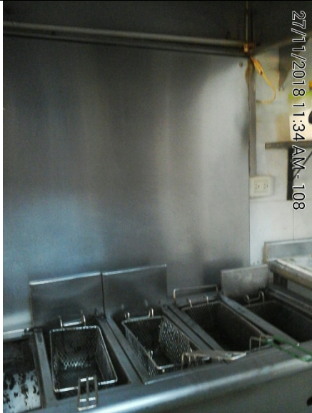
Fotografía No.3 Freidora de 4 puestos