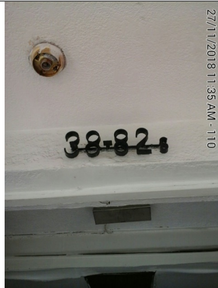
Fotografía No.2 Nomenclatura del establecimiento.