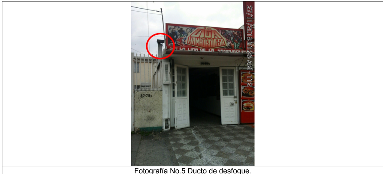
Fotografía No.5 Ducto de desfogue.