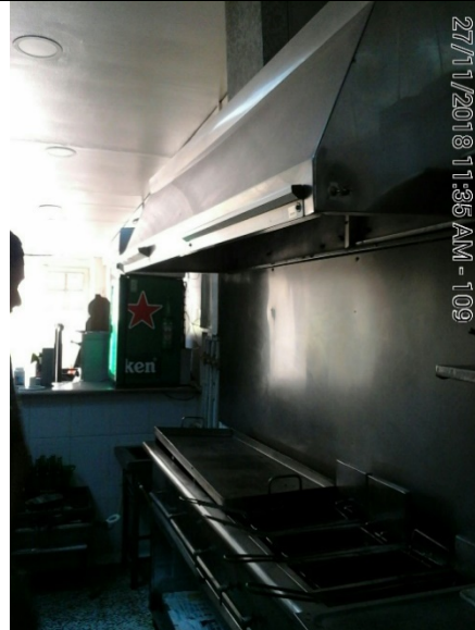
Fotografía No.4 Parrilla de 7 flautas y campana extractora sobre ambas fuentes.